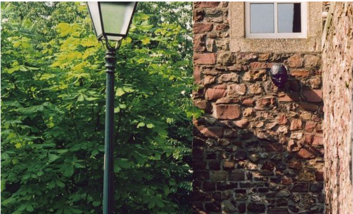
TÊTE NOIRE INSTALLATION SONORE 2006