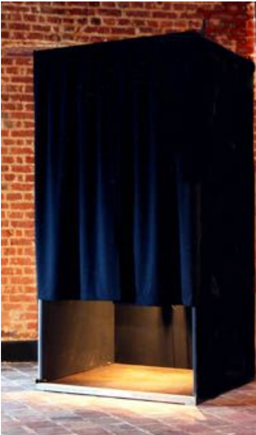
ZONE DÉSERTIQUE INSTALLATION VIDÉO 2006